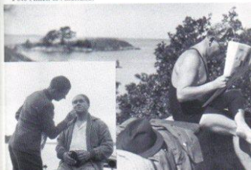
Sommarpaus på Torö med "fram för framgång". Infälld Jussi Björling och sminkör.